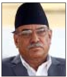
पुष्पकमल शहाल 'प्रचण्ड'

माग मधेशवादी पक्षले राखेको पाइँदैन। वि.सं. २०५० सालमा नै तत्कालीन श्री ५ को सरकार र नेपाल सद्भावना पार्टीबीच ४ वट्टै सम्झौता गरेको थियो। त्यसपछि फेरि, ने.स.प.स.प. श्री ५ को सरकारले तीनवट्टै सम्झौता गरेको थियो। त्यतिबेला दुई पटक नेपाल सरकारसँग भएको सम्झौतामा मागहरू पूरा गरिने प्रतिबद्धता जनाइएको थियो। तर, आजसम्मको मितिमा अर्थात् २३ वर्षपछि पनि मधेशीको समस्या जहोकै तहो छ। त्यसपछि वि.सं. २०६४ सालमा नेपाल सरकारले मधेशी आन्दोलनकारीसँग दुईवटा सम्झौता गरे। एउटा उपेन्द्र यादव नेतृत्वको तत्कालीन मधेशी जनअधिकार फोरम नेपालसँग र अर्को संयुक्त लोकतान्त्रिक मधेशी मोर्चासँग। आजसम्म प्रचण्डकै लिखित वा मौखिकरूपमा मधेशीलाई आश्वासन मात्र दिने गरेका छन् राज्य सञ्चालकहरूले।