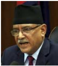
प्रधानमन्त्री पुष्पकमल दाहाल 'प्रचण्ड'