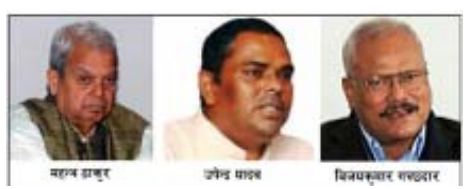
राजपा अध्यक्ष ठाकुरले चुनाव चिन्ह नभएकोले निर्वाचनमा जान नसकिने बाध्यता स्पष्ट पारेका छन्। फोरम नेपालका अध्यक्ष यादव र लोकतान्त्रिक फोरमका अध्यक्ष गच्छदारसँगको छलफलमा

काठमाडौं। मधेशवादी शक्तिबीच सरकारका लागि त्रिपक्षीय छलफल भएको छ। महन्थ ठाकुर नेतृत्वको राष्ट्रिय जनता पार्टी नेपाल, उपेन्द्र यादव नेतृत्वको संघीय समाजवादी फोरम नेपाल र विजयकुमार गच्छदार नेतृत्वको नेपाल लोकतान्त्रिक फोरमबीच सहकार्यका लागि छलफल भएको हो।