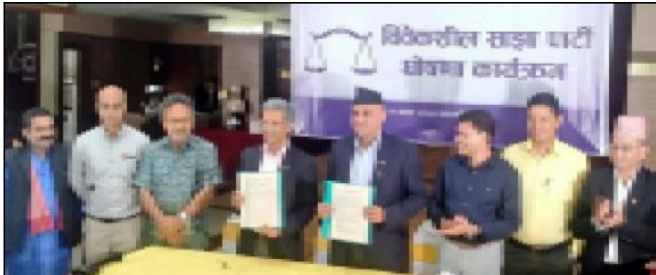
राजधानीमा बुधवार आयोजित विवेकशील साभा पार्टी घोषणा कार्यक्रममा सहभागी नेतागण ।

काठमाडौँ । रविन्द्र मिश्र नेतृत्वको साभा पार्टी र उज्वल थापा नेतृत्वको विवेकशील नेपाली पार्टीबीच एकीकरण भई "विवेकशील साभा पार्टी" घोषणा भएको छ । बुधवार राजधानीमा आयोजित एक समारोहमा विवेकशील साभा पार्टीको घोषणा भएको हो । एकीकृत पार्टीको चुनाव चिन्ह तराजु राखिएको छ ।