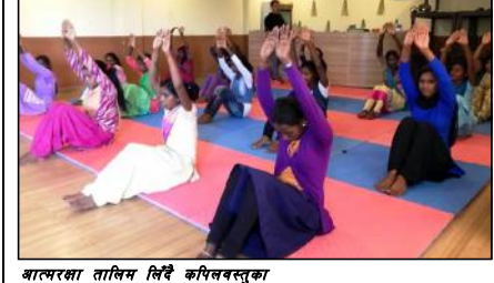
आत्मरक्षा तालिम लिई कपिलवस्तुका

दिलिपकुमार यादव, कपिलवस्तु। किशोरीहरूमाथि हुनसक्ने दुर्घटना तथा दुर्व्यवहारबाट जोगिनका लागि कपिलवस्तुमा आत्मरक्षा तालिम चर्दै आएको छ। कपिलवस्तुमा किशोरीहरूमाथि हुने जबरजस्ती करणी, बलात्कार, दुर्व्यवहार जस्ता क्रयाकलाप बहिर्दहेको बेला यस्तो तालिमको आयोजना गरिएको हो।