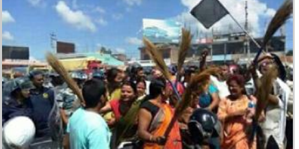
एमालेविरुद्ध प्रदर्शन गर्दै राजपाका नेता

जनकपुरधाम। जनकपुरधाममा नेकपा एमालेको चुनावी सभामा राष्ट्रिय जनता पार्टी नेपालका नेता कार्यकर्ताहरूले विधोलेका छुट। प्रदेश नं. २ को स्थानीय तहको निर्वाचनलाई लक्षित गर्दै मधेशकोन्द्रित भई एमाले विरुद्ध नेता माधवकुमार नेपाल चुनावी प्रचार प्रसामा निकैका हुन। विरुद्ध नेता नेपालले जनकपुरधामको पिडारी चौकस्थित जानकी बाटिकाको राजपा सभाको आयोजना गर्न लाग्दा राजपा नेपालका नेता कार्यकर्ता तथा स्थानिय जनताहरूले विधोलेका छुट। एमाले मधेश रोडोडी रहेको भन्दै कार्यकर्ता विधोलेका सुशकाभीसंग भडकसमेत भएको थियो। भडकमा एक दर्जननभन्दा बढी नेता कार्यकर्ता तथा सर्वसाधारण भाइते भएका छुट।