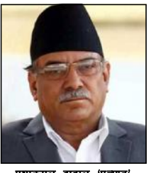
पुष्पकमल दाहाल 'प्रचण्ड'

सहमति गर्ने तर लागू नगर्ने महिनेसम्म अधिकारका लागि चलेको मधेश आन्दोलनलाई कांग्रेस र माओवादीले सहजगती गयो तर ती सहमतिका बौद्धिक श्रिलेखमा लागू भएको अवस्था छैन। वि.सं. २०५४ साल १९ गते कांग्रेस-माओवादीले तत्कालिन मधेशी मोर्चासँग तीनवटै सहमति गरी आन्दोलनका मागहरू पूरा गर्ने बाचा गर्यो। सहमतिका तेश्रो नम्वरको बुझा नुन मधेशी मोर्चाले गर्नुने थियो त्यो तत्कालै भयो नुर, कांग्रेस-माओवादीले अधिकतम गर्न सकेका छैनन्। मधेशी आन्दोलनकारीहरूमाथि लागेको भ्रष्टा मुद्दा कित्ता भएको छैन। पत्नी, सताइका नेपाली कांग्रेस र माओवादी केन्द्रले लगायत एकै बर्षपछि त्यही मुद्दालाई सम्योहन गर्नका लागि पुनः सहमति गर्यो। कांग्रेस-माओवादीले २०७४ जेठ २२ गते राष्ट्रिय जनता पार्टी र राष्ट्रिय समाजवादी फोरमसँग तीनवटै सहमति गरेको थियो।