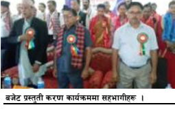
बजेट प्रस्तुती करण कार्यक्रममा सहभागीहरू।