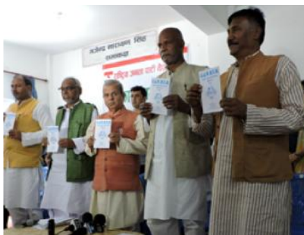
चुनावी घोषणापत्र सार्वजनिक गर्दै राजपा अध्यक्ष मण्डलका

काठमाडौं। राष्ट्रिय जनता पार्टी नेपालले स्वस्थानीय तहको चुनावका लागि घोषणा पत्र सार्वजनिक गरेको छ। पार्टीका अध्यक्ष मण्डलका नेताहरूले संयुक्त रूपमा घोषणा पत्र सार्वजनिक गरेका हुन्।