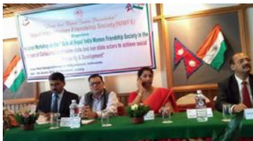
नेपाल-भारत महिला मैत्री समाजद्वारा आयोजित कार्यक्रममा प्रतिभागि ।