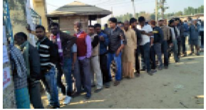
धनुषामा मतदानका लागि लाइनमा बसेका मतदाताहरू।