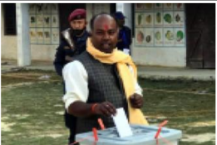
राजपा नेपालका महासचिव मनिष सुमन मतदान गर्दै।