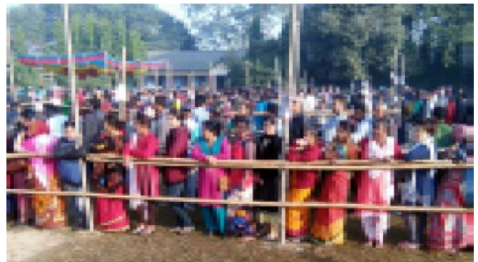
मोरङको विराटनगर महानगरपालिकामा मतदानका लागि लाइनमा बसेका मतदाताहरू।