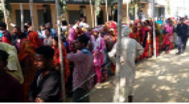
सिरहाको लहानमा मतदानका लागि लाइनमा बसेका मतदाताहरू।