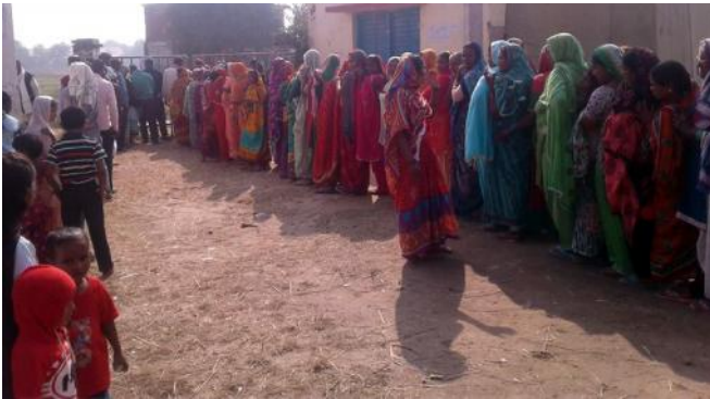
वीरगन्ज महानगरपालिकामा मतदानका लागि लाइनमा बसेका मतदाताहरू।