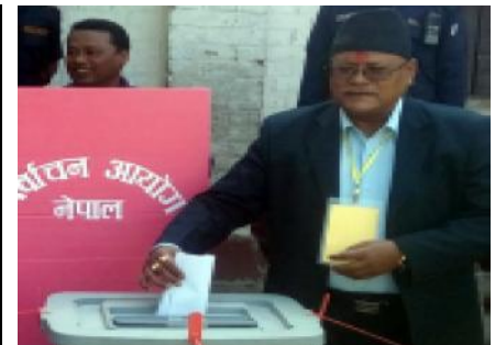
उपप्रधानमन्त्री तथा नेपाली कांग्रेसका नेता विजयकुमार गच्छदार मतदान गर्दै।