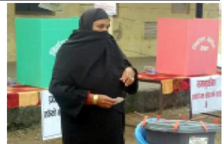
बाँकेको एक मतदान केन्द्रमा मतदान गर्दै मुस्लिम महिला।