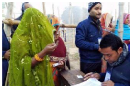
महोत्तरीको एक मतदान केन्द्रमा मतदान गर्दै एक महिला।