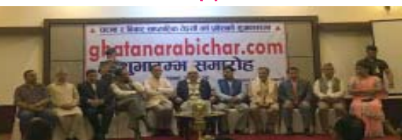
घटना र विचार साप्ताहिक पत्रिका २३औं वर्ष प्रवेश गरेको अवसरमा आयोजित कार्यक्रममा सहभागीहरू ।

काठमाडौं । प्रत्येक बुधवार प्रकाशित भइरहेको बुधवार साप्ताहिक २३औं वर्षमा प्रवेश गरेको अवसरमा पत्रिकाले आयोजना गरेको एक समारोहका बीच आफ्नो अनलाइन पोर्टलसमेत सञ्चालन गरेको छ । सर्वोच्च अदालतका कामु प्रधानन्यायाधीश गौडाले पराजुलीले www.ghatanarabichar.com को शुभारम्भ गरेका थिए । सो कार्यक्रममा कामु प्रधानन्यायाधीश पराजुलीले शुभकामना दिँदै