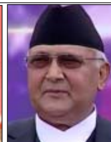
केपी शर्मा ओली

लगाउँदै आएको छ । अहिले आफूहरू पनि संशोधनविने चुनावमा जानुपर्ने अवस्था आएपछि राजपा ठूलो चेपुवामा परेको छ ।