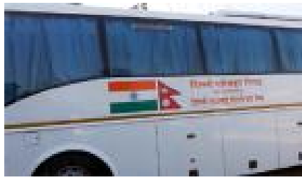
नेपाल र भारतका बिभिन्न शहरहरूलाई सीधा सडक मार्फत जोड्नु भन्ने दुई देशबीच यात्रु बस आवागमन अहिले १३ वटा रुटमा सञ्चालन भइरहेको छ ।

नेपाल र भारतका बिभिन्न शहरहरूलाई सीधा सडक मार्फत जोड्नु भन्ने दुई देशबीच यात्रु बस आवागमन अहिले १३ वटा रुटमा सञ्चालन भइरहेको छ । हाले भारतको पश्चिम क्वालको सिलिगुडीबाट पूर्वी नेपालको काठमाडौँ हुने कठमाडौँ र काठमाडौँबाट सिलिगुडीसम्मका लागि यात्रु बस सञ्चालन हुन थालेको छ ।