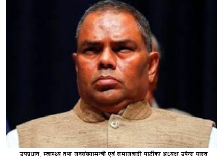
उपप्रधान, म्वास्थ्य तथा जनसंख्यामन्त्री एवं समाजवादी पार्टीका अध्यक्ष उपेन्द्र यादव

काठमाडौं। संविधानको पुनर्लेखन नै गर्नुपर्ने माग गरेका उपप्रधानमन्त्री तथा समाजवादी पार्टीका अध्यक्ष उपेन्द्र यादव अहिले रतभूल्यमा परेका छन्। संविधानको पुनर्लेखनको कुरा परे जाओस्, संविधानको मुद्दामा दुई बुट्टे सहमति गरेका सतारोहण गरेका यादवलाई अहिले आफ्नो सरकारी पद जोगाउन मुस्किल परेको छ। नयाँ शक्ति पार्टीसँग एकीकरण पछि आफ्नो माग पूरा नभए सरकार पनि छाड्न सक्ने उनले पटक-पटक अभिव्यक्ति पनि दिए। उपप्रधानमन्त्री भएर पनि सरकारको खरो आलोचनामा उत्रिएका यादवलाई प्रधानमन्त्री केपी शर्मा ओलीले व्यवहार मूल्यांन चेतवनी दिएपछि उनी अहिले दोधारमा परेका छन्। ओलीले यादवलाई पदबाट हटाइ दिने पनि धम्की दिएको पार्टीभित्र चर्चा चल्योको छ।