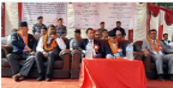
नेपाल-भारत मैत्री पोलिटेक्निक परियोजना भारत-नेपाल विकास साझेदारी कार्यक्रमअन्तर्गत भारत सरकारको भा.रु. ३८.४३ करोड इण्डियन लि.ले पूर्वाधार निर्माण भइरहेको छ। निर्माण कन्सल्टेन्ट्स प्रा.लि.ले परियोजना व्यवस्थापन परामर्शदाताको रूपमा तथा टेलिकम्युनिकेशन्स कन्सल्टन्ट इण्डिया लि.ले पूर्वाधार निर्माण देकादारको रूपमा ३२ एकडभन्दा